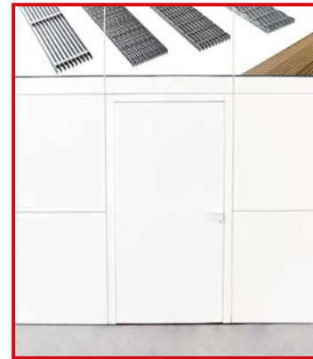
Displays, Podeste und freihängende Werbeelemente wie Banner und Kuben werden auf Wunsch in der gleichen Rahmenbauweise produziert.