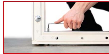
Höhenverstellbare Montagefüße ermöglichen auf allen Untergründen eine exakte waagerechte Ausrichtung des Messestandes.