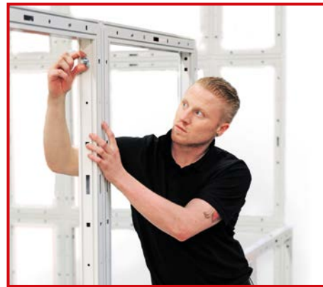
Der werkzeuglose Aufbau sowie die flexibel einsetzbaren Rahmen machen dieses System zu einem der schnellsten auf dem Markt.

chere Transport und die Verpackung Argumente, die für unser Produktsortiment sprechen. Speziell angefertigte Montagewagen erleichtern nicht nur die sichere und stoßfreie Anlieferung zur jeweiligen Messe, sondern ermöglichen zudem eine möglichst große Flexibilität und Beweglichkeit beim Auf- und Abbau.